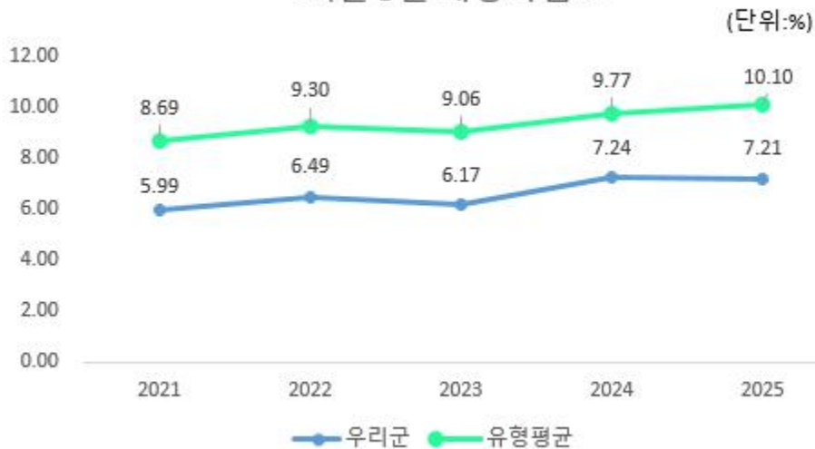
최근 5년 재정자립도

우리군의 재정자립도는 2024년도에 전년 대비 상승하였다가 금년은 24년도와 거의 비슷한 수준으로, 동일 지자체 유형평균에 비해서는 다소 낮은 편입니다.